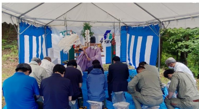
安全祈願祭の様子