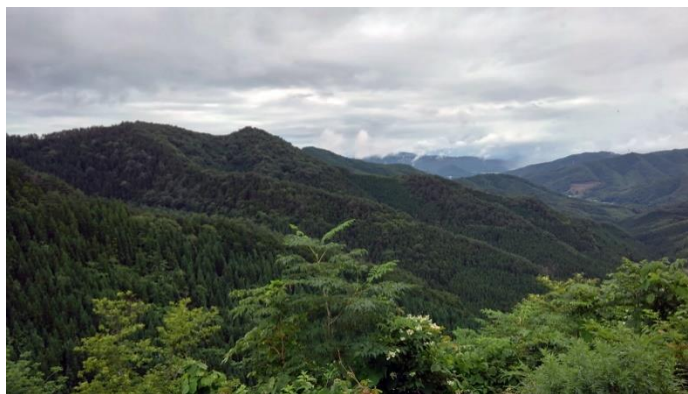
岩手県花巻市に取得した約 240 ヘクタールの山林