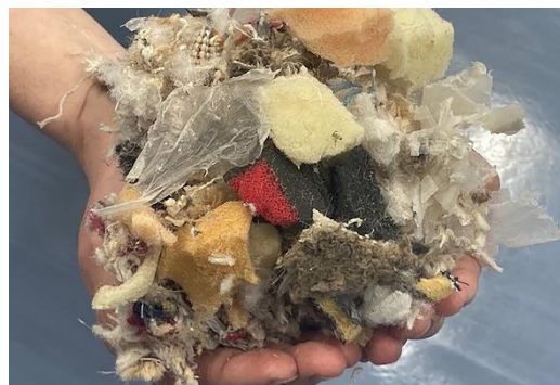
破碎されたカーペット・ふとん